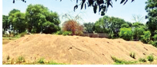
हरिभूमि न्यूज ▶ बैतूल

अवैध रेत भंडारण पर खनिज विभाग ने की कार्रवाई, 2 लाख होगा जुर्माना