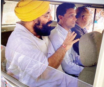
को उपजेल में भेज दिया है।